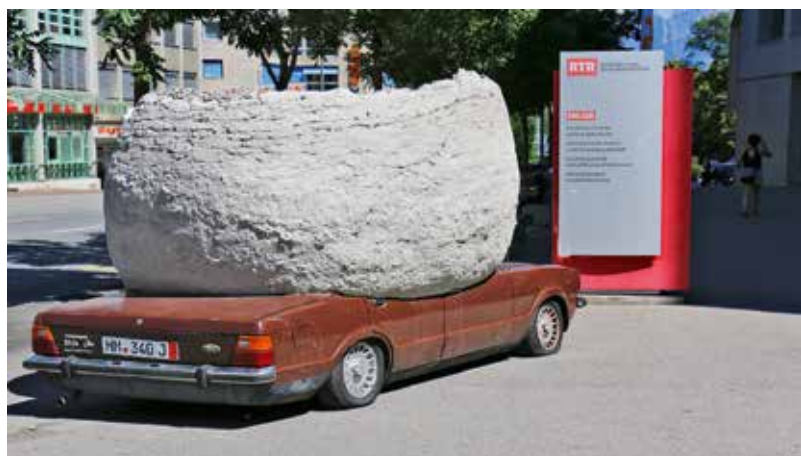
Enfin la fin d'october han ins pudì admirar «Drifted pit, OI#16231» davant la chasa RTR a Cuira.

Las emissiuns e tut ils detagls dals Dis da litteratura 2016 sa chattan sin nossa pagina rtr.ch/cultura .