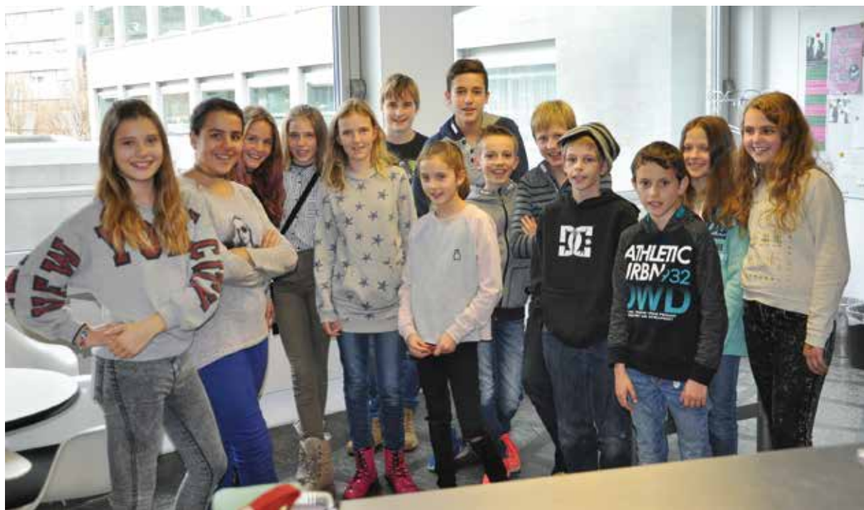
Ils 10 da november han mattatschas e mattatschs da Scuol enfin a Ziràn e Sedrun pudì guardar sur la spatla a schurnalistas e schurnalists da RTR en la chasa da medias a Cuira.