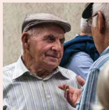
... il protagonist Dumèni Dolf.

cidi da far mez la distribuziun. Era qua datti bler d'emprènder, marketing, scriver texts da pressa, far ina pagina d'internet, etc.