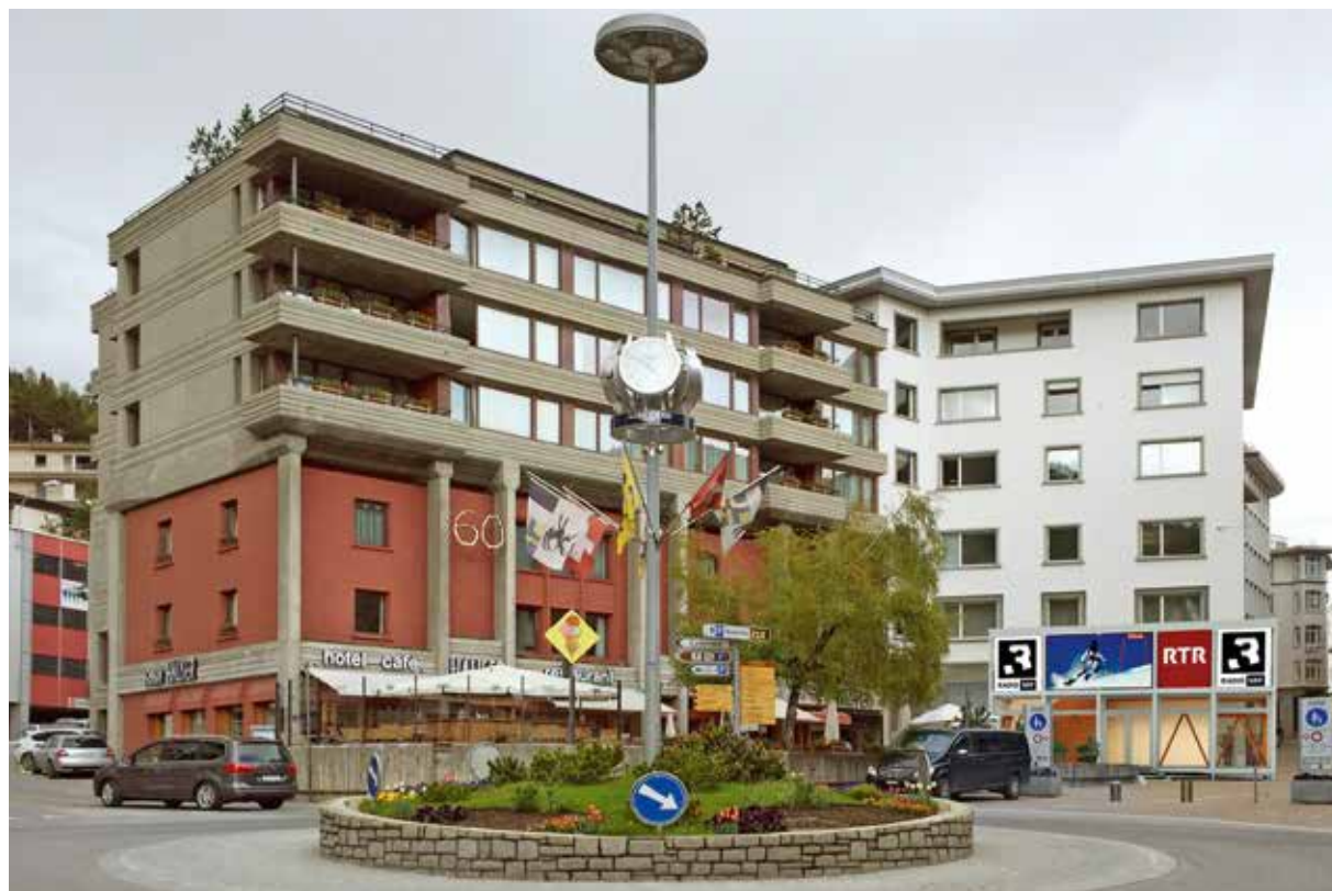
Ensemen cun radio SRF3 sa preschenta RTR davant il café Hauser a San Murezzan.

Ensemen cun radio SRF3 sa preschenta RTR davant il Café Hauser. Visitadras e visitaders pon dar ina baterlada, participar al giu da tippa, sa sentir sco in atlet e participar ad ina cursa da skis virtuala cun egliers da 360°. En il studio s'inscuntran collavuraturas e collavuratur da RTR e da SRF3 cun la populaziun da San Murezzan ed ils