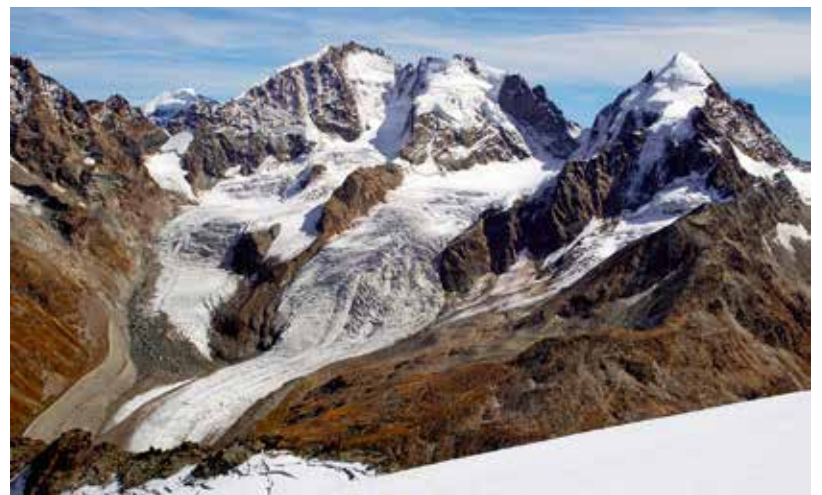
Il clima sa mida: Ils glatschers lieuan, ed en la politica va in vent criv.

differenzià. Dus temas che vegnan influenzads principalmain da facturs exogens (clima e martgà internaziunal) e cun ils quals RTR è s'occupà adina puspè durant l'entir onn èn: la crisa dal turissem ed il privel (cunt. pag. 2)