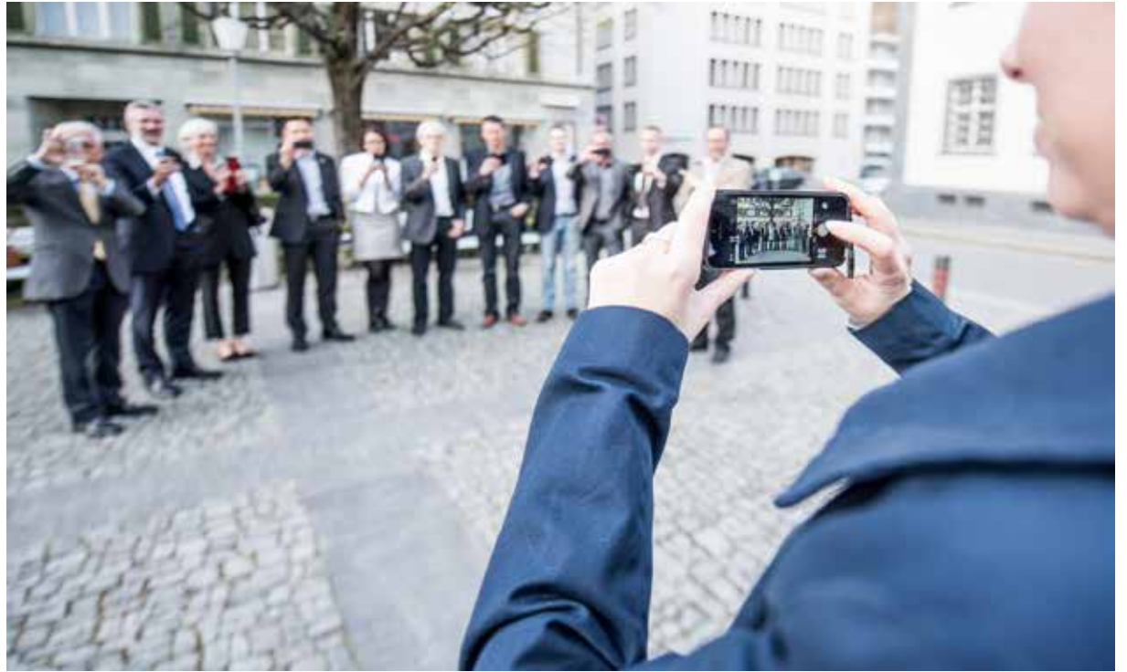
Il smartphone drov'ins per fotografar, s'infurmar e mintgant era per telefonar.

Per ils dus represchentants da las medias electronicas che han participà al podium è la chaussa clera: