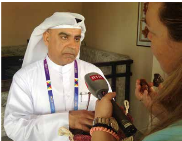
In beduin dal Catar declera a la redactura pertge ch'ins avess da mangiar mintga di datlas.

Cuntents, ma magari era stracs èn ils dus redacturs finalmain turnads suenter lur segiurn ventirivel en l'Italia cun bleras impres-siuns, numerus maletgs e novas experientschas.