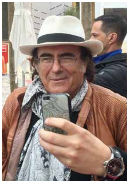
Er il chantadur Al Bano Carrisi ha dà pled e fatg a Radio Rumantsch.